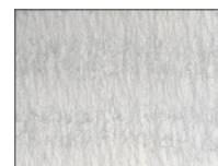
JUISTE TOEPASSING = 20 droge g/m 2