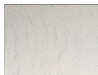
DEKKING TE LICHT